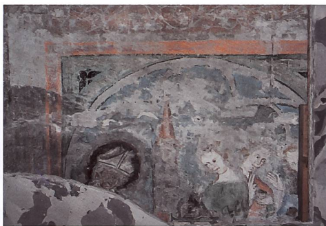
Fig. 149 Fragment de la peinture médiévale à l'arrière de l'autel de la Nativité, signalée en 1987 et mise au jour lors de la restauration de l'autel de la Nativité en 2011, scène de la Vie de saint Nicolas. La partie plus sombre correspond à la trace en négatif d'un autel antérieur, plus bas et moins développé que l'actuel réalisé en 1753 par Johann Jakob et Franz Joseph Moosbrugger.

La nature du liant utilisé pour appliquer les couleurs n'a pas pu être déterminée de manière précise. Il s'agit tout d'abord d'une peinture appliquée directement sur un appareil en molasse, sans enduit intermédiaire. Comme pour les piliers présentés précédemment, cet appareil aurait nécessité une imprégnation préalable permettant de réduire la porosité de la pierre pour pouvoir appliquer convenablement la peinture. C'est pour cette raison peut-être que nous trouvons fréquemment dans les couches de préparation du rouge de plomb déjà connu à l'époque pour ses qualités siccatives et résistantes lorsqu'il est mélangé avec de l'huile. En outre, les observations des conservateurs-restaurateurs ont mis en évidence l'aspect craquelé de la couche picturale si caractéristique des peintures à l'huile. Les analyses ont d'ailleurs systématiquement relevé la présence de substances organiques dans les couches picturales, telles que