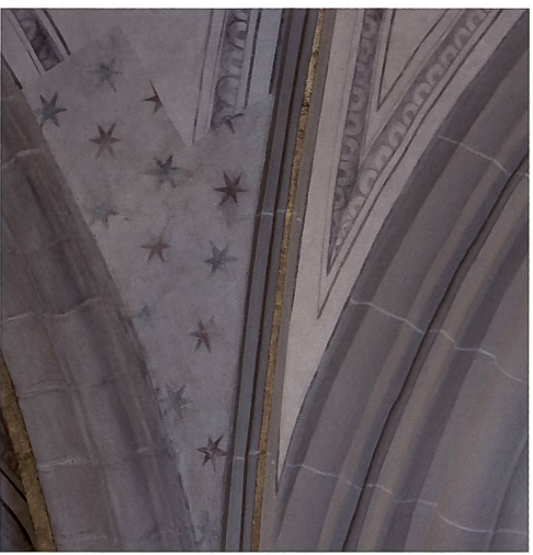
Fig. 141 Voûtain de la 3 e travée du collatéral nord avec le décor d'étoiles en lignes de la 1 re moitié du XIV e siècle, dégagé sous l'enduit de 1648 à bordures grises en trompe-l'œil.

Ces vestiges de polychromie mettent en évidence deux phases de décoration. La plus ancienne est caractérisée par une succession de petites croix blanches se détachant sur des fonds rouge et gris appliqués directement sur la pierre en alternance. La coloration brunâtre sous-jacente laisse penser que la pierre aurait été