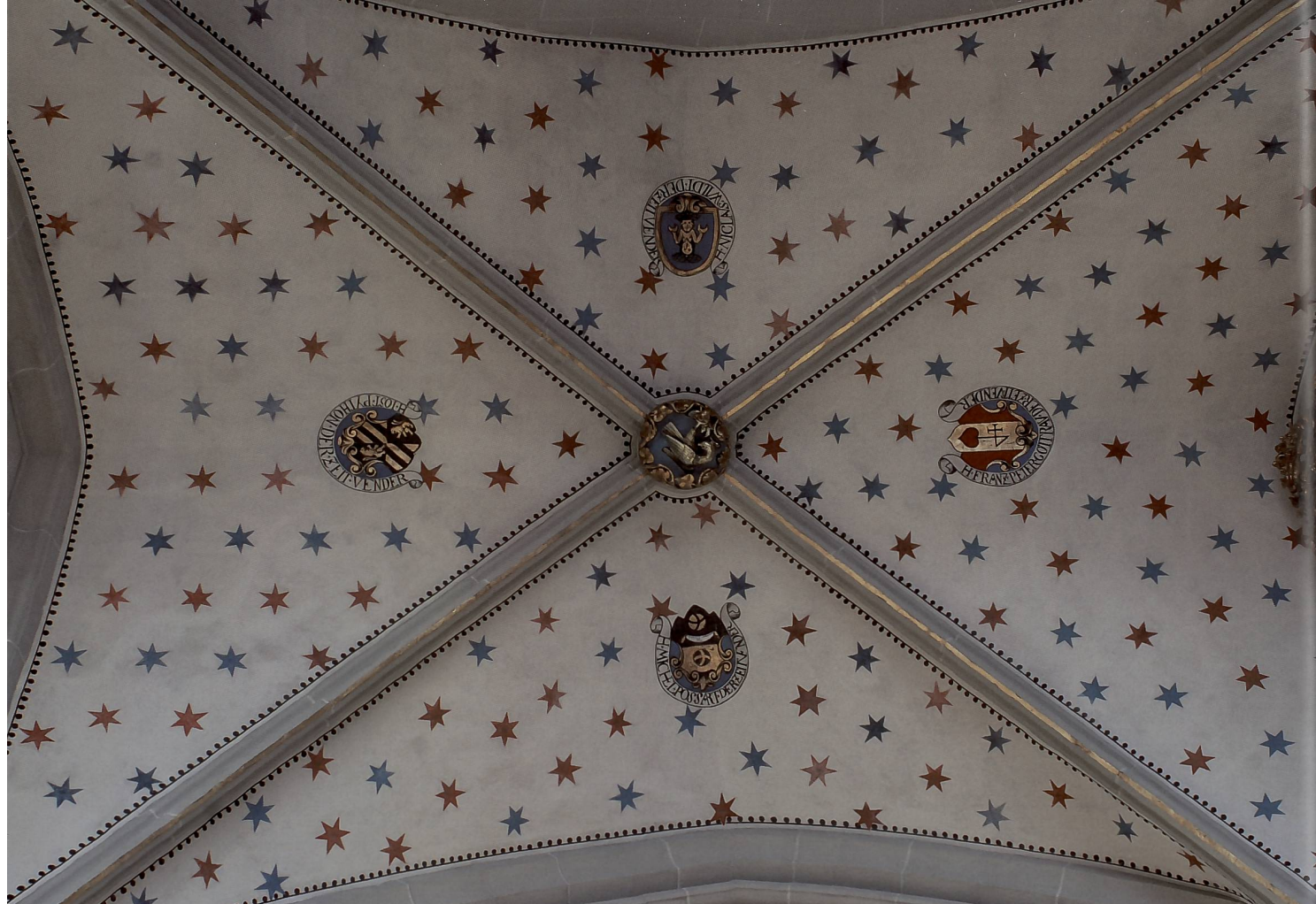
Fig. 140 Voûte de la 1 re travée du collatéral sud, avec décor reconstitué par Stajessi en 1949, mêlant des éléments du XVI e (filet noir à perles) et XVII e (écus armoriés) siècles à un semis d'étoiles évoquant le décor primitif gothique du XIV e siècle où les étoiles sont cependant disposées en lignes.

car il s'agissait de substances très onéreuses pour l'époque, indiquant une volonté d'enrichir les surfaces architecturales de manière ostentatoire et prouvant les moyens financiers ou la dévotion particulière du maître d'ouvrage à son église. Quelques vestiges de décor à Saint-Nicolas attestent que la pierre des nervures séparant les voûtains était recouverte d'un badigeon de fond blanc cassé, sur lequel étaient peints des faux-joints relativement élaborés, composés d'un filet rouge flanqué de deux filets noirs (fig. 145). Ces faux-joints ne suivaient pas toujours les vrais joints des voûtures, la décoration peinte privilégiant la logique architecturale en régularisant les éléments constructifs et en harmonisant les articulations.