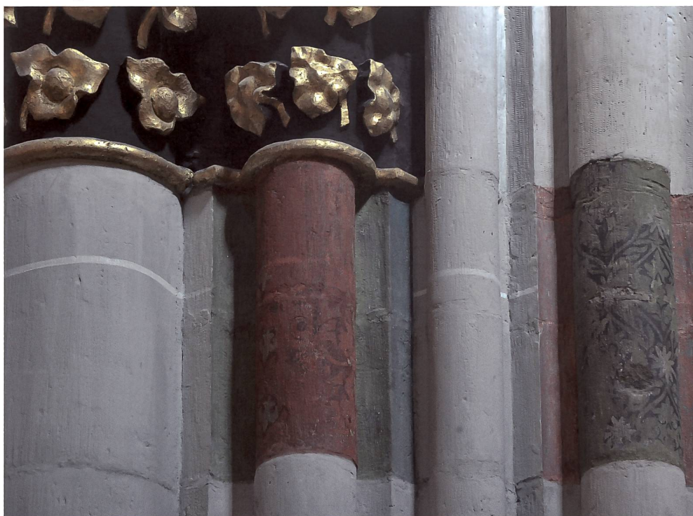
Fig. 142 Troisième pilier nord de la nef, avec témoin du décor médiéval à motif d'arabesque sur les colonnettes à teinte rouge et vert alternant avec celle des canaux.

techniques sophistiquées et de matériaux divers et onéreux. Plusieurs échantillons provenant de la pierre polychrome de la 3 e travée du collatéral sud révèlent ainsi une seule phase de décoration constituée d'une stratigraphie relativement complexe. On y trouve systématiquement une couche rouge orangé peinte directement sur la pierre, servant de fond de préparation et sur laquelle les autres couleurs (bleu, vert, rouge, etc.) sont ensuite appliquées, soit sous formes visibles, soit plus subtilement pour rehausser l'effet des couleurs superposées. Le rouge est