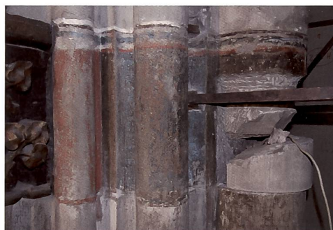
Fig. 143 Deuxième pilier nord de la nef, après dépose de l'abat-voix de la chaire, avec fragment du 2 e décor médiéval couvrant les petites croix blanches initiales sur fond rouge et gris appliqué directement sur la pierre.

À côté de ces sondages et observations, un nombre important d'analyses de prélèvements a été réalisé, permettant de mieux connaître les matériaux et les techniques utilisés au XIV e siècle 4 . Ces analyses, dont la synthèse globale reste à faire, révèlent une fois encore l'utilisation de