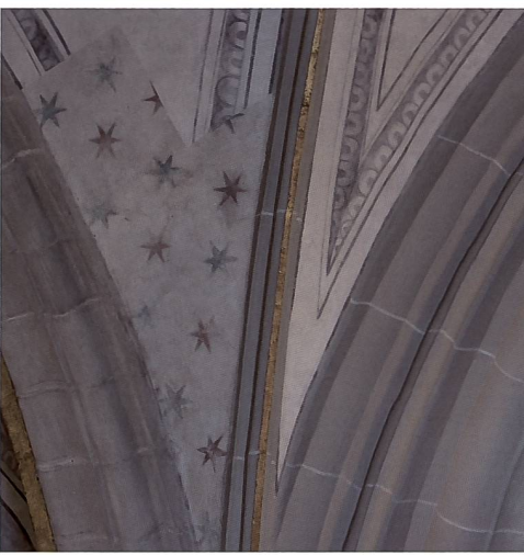
Fig. 141 Voûtain de la 3 e travée du collatéral nord avec le décor d'étoiles en lignes de la 1 re moitié du XIV e siècle, dégagé sous l'enduit de 1648 à bordures grises en trompe-l'œil.

Ces vestiges de polychromie mettent en évidence deux phases de décoration. La plus ancienne est caractérisée par une succession de petites croix blanches se détachant sur des fonds rouge et gris appliqués directement sur la pierre en alternance. La coloration brunâtre sous-jacente laisse penser que la pierre aurait été