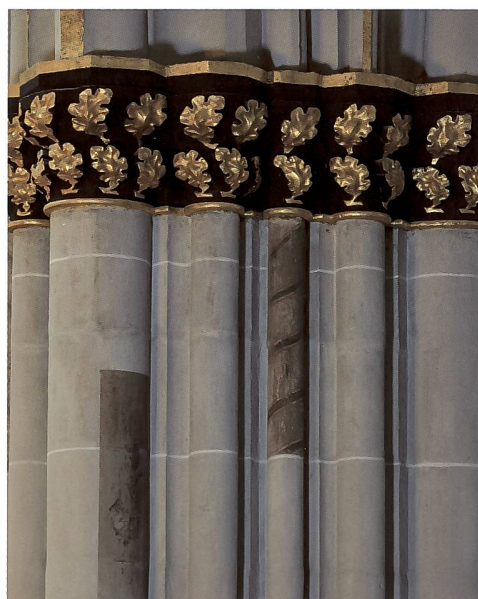
Fig. 144 Troisième pilier sud de la nef avec vestiges de peinture médiévale dont un Calvaire tout à gauche et une torsade polychrome sur l'une des colonnettes.

Lorsque l'on regarde les chapiteaux actuels, il est difficile d'imaginer leur richesse polychrome au XIV e siècle. Leur traitement en bichromie, à motifs végétaux dorés sur fond noir, remonte certainement au XVII e siècle et doit être contemporain du décor baroque en trompe-l'œil des voûtes. Il a été maintenu et restauré lors des transformations du milieu du XVIII e siècle, avec l'application d'une nouvelle dorure à la mixtion, puis renouvelé aux XIX e et XX e siècles avec retouches et surpeints à base de peinture à la bronzine. Ces couches successives ont empâté la sculpture et cachent sa valeur plastique. Au XIV e siècle, les chapiteaux étaient richement colorés comme le montre un témoin conservé dans la 1 re travée du collatéral nord, corroboré par les observations et analyses faites dans les autres travées. Au lieu du fond noir, la corbeille