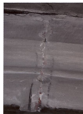
Fig. 145 Détail de l'arc doubleau séparant la 2 e et la 3 e travée du collatéral nord, avec rare témoin du décor de faux-joints médiéval, composé d'un filet rouge entre deux filets noirs.

Dans la 1 re travée du collatéral sud, le peintre-décorateur a entièrement reconstitué le décor aux étoiles bleues et rouges que l'on vient de décrire, vraisemblablement sur la base de sondages ou de portions de décor visibles dans les lacunes des badigeons de l'époque (fig. 140). Sa reconstitution présente pourtant d'importantes différences avec le décor médiéval d'ori-