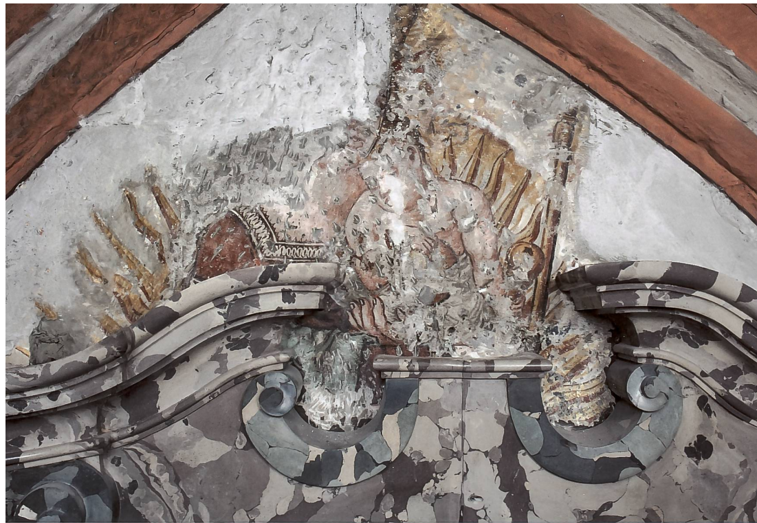
Fig. 150 Derrière l'attique de l'autel de la Nativité, vestige de décor baroque, Notre-Dame des Victoires, entre 1627 et 1650, état après nettoyage et conservation.

huile, jaune d'œuf, résine, gélatine, sans pouvoir préciser avec certitude leur nature exacte, ce qui aurait nécessité des examens plus approfondis. La présence de gélatine pourrait être expliquée, en partie, par la contamination des échantillons lors du traitement de consolidation entrepris lors de l'actuelle campagne de restauration. Mais d'autres indices et d'autres exemples de peintures médiévales comparables sur appareil en pierre, nous permettent d'envisager l'utilisation de l'huile pour l'application de couleurs à cette époque comme hautement vraisemblable, en combinaison peut-être avec d'autres liants comme de l'œuf.