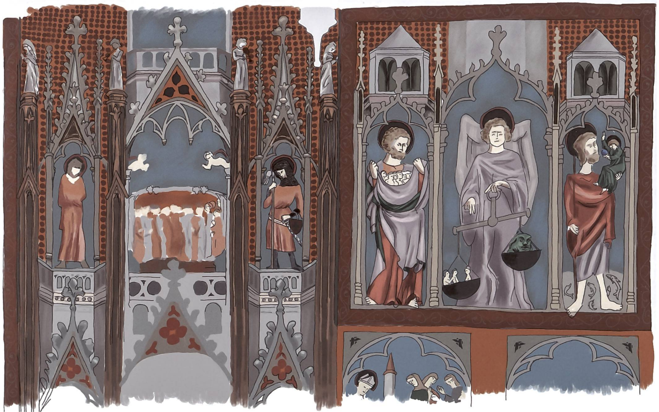
Fig. 154 Reconstitution de la peinture murale montrant notamment la disposition de ses registres et la position de la console.

apparaît: «Que fais-tu là, méchante bête? Tu ne peux plus rien contre moi, car je vois déjà Abraham qui m'ouvre les bras!» 6 . L'importance des messes commémoratives pour le salut des défunts et leur accès au Paradis est bien exprimé dans le roman courtois Le Conte du Graal : «si elle [la mère de Perceval] est morte, vous célébrerez chaque année un service pour son âme, afin que Dieu la mette dans le sein d'Abraham en compagnie des âmes pures» 7 . Une promesse particulière est liée à l'image de saint Christophe. Avant sa mort en martyr, le saint géant aurait demandé à Dieu que la ville où se trouverait sa tombe soit préservée de la grêle, du feu, de la famine et de la «male mort». S'il devait y avoir des routes «malsaines», les voyageurs qui les emprunteraient en priant Dieu de tout cœur tout en invoquant saint Christophe seraient préservés 8 . La conviction de la force protectrice particulière du saint à l'heure de la mort a été entretenue et renforcée par des images de grand format. Elles se trouvaient généralement à l'intérieur des églises sur le Plateau suisse et à l'extérieur, le long des voies de communication, dans les zones alpines. Visibles de loin, ces saints Christophe étaient censés protéger contre