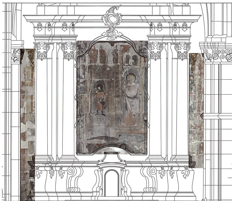
Fig. 153 Le mur oriental, avec relevé du retable et décor médiéval stabilisé et nettoyé en 2012.

Un vestige ténu nous permet une hypothèse quant à la figure centrale autour de laquelle se développait tout le décor. On distingue en effet une console en pierre aujourd'hui coupée au ras du mur, insérée à la hauteur des parties sommitales des architectures feintes, correspondant à la hauteur des chapiteaux réels. Elle a dû servir de support à une statue de la Vierge, indispensable en tant que patronne de la chapelle. Le vocable actuel «de la Nativité» remonte en effet au XVIII e siècle seulement. Le chanoine Fuchs, se référant sans doute à un tableau de retable, parle encore en 1687 de l'autel de la Vierge adorant l'Enfant Jésus 4 . On peut donc supposer une Nativité dans le compartiment central de l'architecture gauche ainsi qu'une scène de la vie de la Vierge dans la partie supérieure; et pourquoi pas la naissance de Marie ou son mariage, scènes auxquelles d'autres femmes assistent