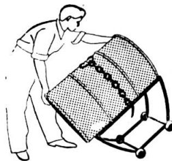
Dank der Abwärlkufen wird das Faß mit Leichtigkeit aufgebockt