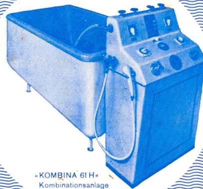
«KOMBINA 61 H» Kombinationsanlage