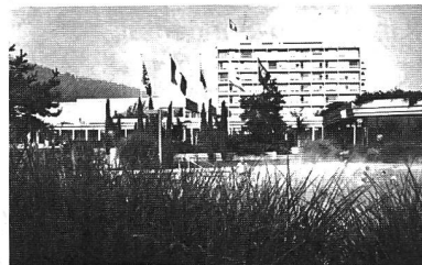
RHEUMA- KLINIK ZURZACH