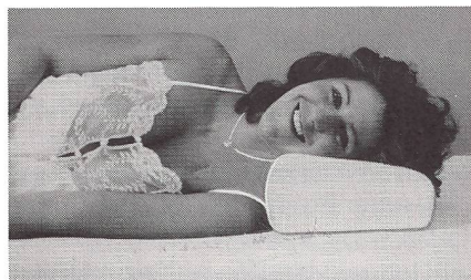
Frau Seitenlage auf Kissen

denn er liegt nicht richtig. Es wird geklagt über Kopf-Nacken-Rückenschmerzen, Schulterblatt-Verspannungen, eingeschlafene Hände etc. Um all diesen Beschwerden abzuwehren, entwickelte die Schweizer Firma Witschi Kissen AG vor 20 Jahren ein orthopädisches Liegehilfen-Programm für Kopf und Beine, mit einer optimalen, anatomischen Formgebung. Das Witschi-Gesundheits-Kopfkissen wird anstelle eines normalen Kopfkissens verwendet und wirkt während den Schlafstunden entkrampfend, streckend, entlastend. – Einerseits durch seine druckstellenfreie, gleichbleibende Stützkraft in Rücken- und Seitenlage, andererseits durch die wohltuende Aufnahme der Ohren in eingeformte Mulden bei Seitenlage und die Kopfmulde bei Rückenlage. Eine Heimtherapie, die jede Wirbelsäule wieder leben lässt. Witschi Kissen werden in einem 6-Grössen-Programm auf jede Schulterbreite passend hergestellt, um ganz gezielt auf Beschwerden des Wirbelsäulen-Systems einzuwirken. Seit 20 Jahren werden diese Spezialkissen erfolgreich im Klinikbereich eingesetzt bei: HWS, BWS, LWS-Syndrom, Nacken-Arthrose, Spondylose, Nacken-Achselverkrampfungen, Kopfschmerzen, Migräne, Bechterew, Schlafschwierigkeiten, nervösen Schlafstörungen, eingeschlafene Hände etc. Schon nach kurzer Liegezeit auf diesem Kissen wird eine spürbare Entlastung herbeigeführt, ein ruhiger Tiefschlaf erreicht und ein beschwerdefreies Erwachen ausgelöst.