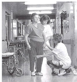
Exercice de marche/conduite.

validité, fiabilité, objectivité, statistique