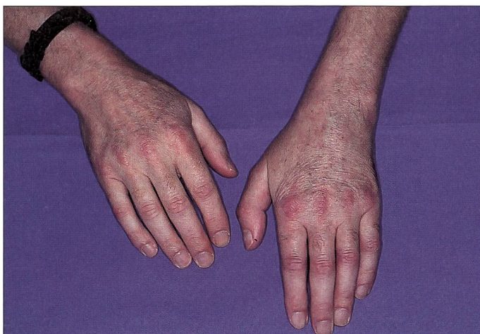
Fig. 1: Comparaison entre une main saine et une main hémiparétique (effacement des arches).

Lorsque le thérapeute responsable de la prise en charge du patient a estimé nécessaire de mouler une OCR, il nous en a informé. Ceci nous a permis de programmer l'évaluation initiale avant ou le jour même du moulage. Chaque patient a été informé des buts de l'étude. La consigne donnée était le port de l'orthèse, préférentiellement la nuit. Nous avons cependant laissé la possibilité d'un port diurne, cette étude ayant également