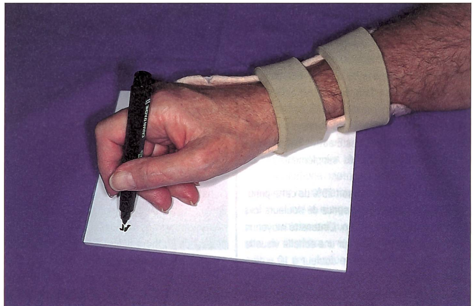
Fig. 5: Activité fonctionnelle facilitée par le port d'une OCR.

Moins d'un tiers des patients étaient concernés par des problèmes d'œdème et de douleurs au repos. La mise en place d'une OCR a permis, en moins de 3 semaines, à raison d'une durée moyenne de 9 heures de port journalier, de résoudre presque totalement ces deux complications. Les résultats de cette étude mettent en évidence un effet biomécanique et circulatoire favorable. Pour cela il est impératif que l'orthèse respecte la position fonctionnelle du poignet et qu'une attention toute particulière soit donnée au réali-