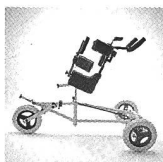
TORO Magic Walker