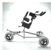
TORO Magic Walker