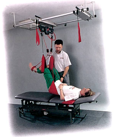
Die dritte Hand des Therapeuten