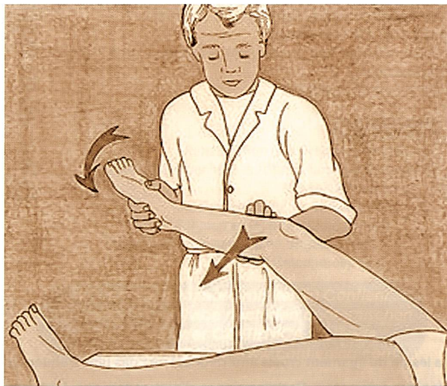
Fig. 2: ressaut rotatoire interne connu sous le nom de pivot shift de MacIntosh: Le patient est en décubitus dorsal, l'examineur soutient le membre inférieur de telle sorte que la cuisse soit fléchie à 45 degrés, le genou à 90 degrés, la jambe en rotation interne. La main inférieure saisit le pied qu'elle met en rotation interne tandis que la main gauche exerce une contrainte en valgus sur l'extrémité supérieure de la jambe.