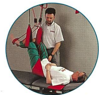
Sling Exercise Therapy

Verlangen Sie unseren Gratis-Gesamtkatalog!