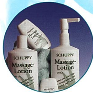
Produkte und Verbrauchsmaterial