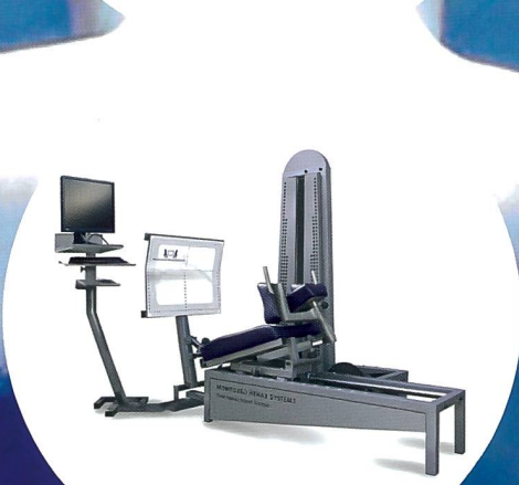
NEU: Monitored Rehab Systems Geräte-Linie.

ratio gmbh medical training rehabilitation • fitness • software Emmenhofallee 3, 4552 Derendingen Telefon 032 681 53 66 Mail: info@mrs-schweiz.ch www.mrs-schweiz.ch