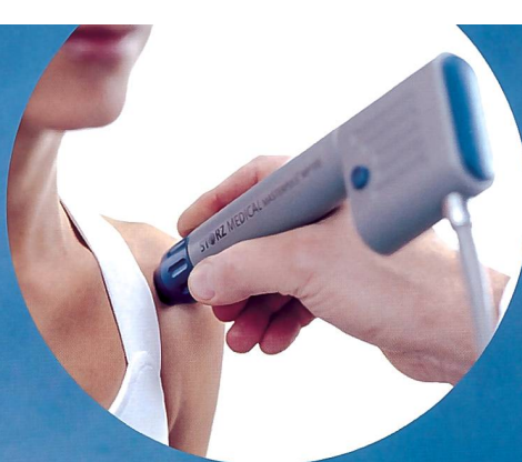
Stosswellentherapie – die neuste Generation von Storz medical.

Die beiden Partner Kölla und ratio (ex Monitored Rehab Systems) begleiten Sie umfassend im Therapie- und Rehabereich. Ob Behandlungsliegen, Theraband, Praxissoftware, Reha-Trainingsgeräte, Elektrotherapiegeräte oder Fitvibe-Trainingsgerät – bei uns finden Sie immer den kompetenten Ansprechpartner.