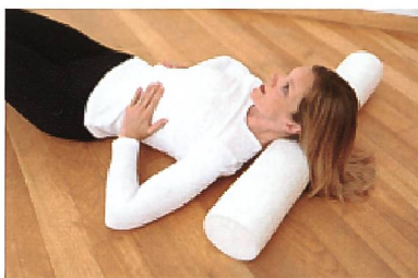
En dialogue avec son propre corps