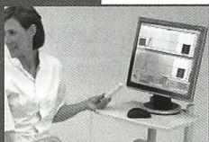
Myofeedback & EMG

Die komplette 2-Kanal Myofeedback Einheit mit 2-Kanal Elektrostimulation