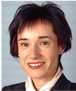
Ruth Humbel Näf, Nationalrätin und Mitglied der Direktion von santésuisse

Der Schweizer Physiotherapie Verband konnte von den Meinungen und offenen Diskussionen unter den Teilnehmenden sehr profitieren. Hinweise darauf, welche Politiker und Schlüsselpersonen angesprochen werden müssen, wenn ein Anliegen der Physiotherapie durchgesetzt werden soll, sind für ein effizientes Lobbying unerlässlich.