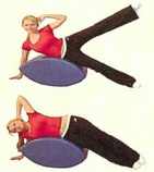
Seitliche Rumpfmuskulatur und äußere Beinmuskulatur

Eine Hüfte aufliegen, Füße und Hand abstützen auf dem Boden, obere Hand liegt hinter dem Kopf. Mit Anspannen des Bauches und Gesäßmuskulatur oberes Bein und Rumpf etwas anheben