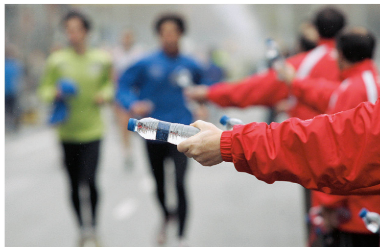
Einmal die Stimmung bei einem Volkslauf zu erleben, kann für ein Training motivieren. | Découvrir l'atmosphère d'une marche collective, cela peut constituer une motivation pour l'entraînement.

U ne maternité, un travail trop prenant, une maladie ou une lésion sont souvent la cause d'une réduction, voire d'un arrêt de la pratique sportive. Comment est-il possible pour nos clients, nos patients, voire pour nous-mêmes, de retrouver un mode de vie actif et de le maintenir sur le long terme? Les aspects essentiels de ce processus sont les suivants: la prise en compte des obstacles personnels, la détermination d'objectifs adaptés, une forte résolution de la personne concernée ainsi que l'obtention de résultats encourageants.