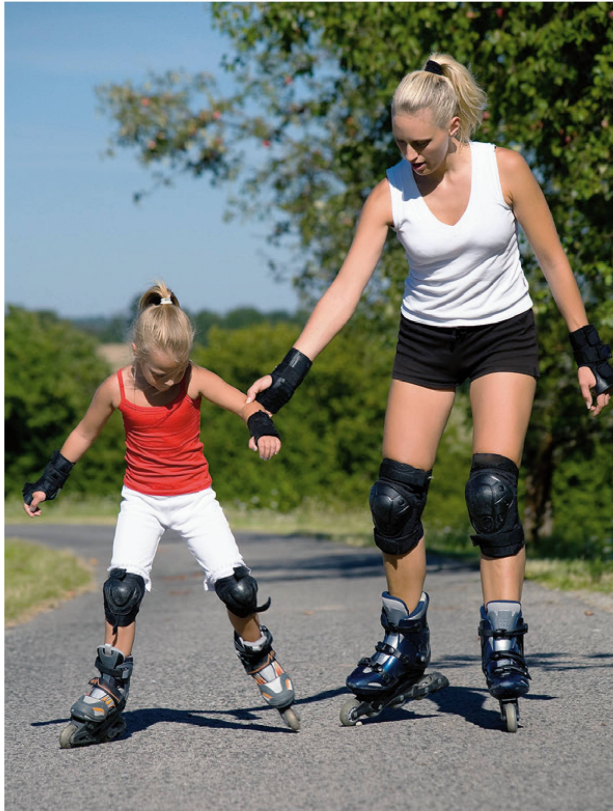
Keine Zeit? Das Wochenende mit der Familie und Freunden aktiv planen. | Pas le temps? Organiser un week-end actif avec la famille et les amis.