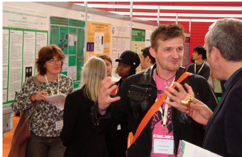
Über 5200 PhysiotherapeutInnen trafen sich zum fachlichen Austausch. I Plus de 5200 physiothérapeutes étaient présents pour échanger sur le plan professionnel.

Das Hauptreferat an der Eröffnung hielt Lorimer Moseley, der bekannte Experte für chronischen Schmerz aus Australien. Er sprach kurz und klar über sein Thema, die Schmerzverarbeitung im Gehirn und wie diese beeinflusst werden kann. Lorimer Moseley hielt fest, dass die PhysiotherapeutInnen und die Weltkongresse ein Motto kennzeichnet: Enjoy! Er sei zum dritten Mal an einem Weltkongress und jedes Mal laute die Aufforderung am Anfang des Kongresses: «Geniesst es, freut euch! Feiern wir gemeinsam die Physiotherapie!»