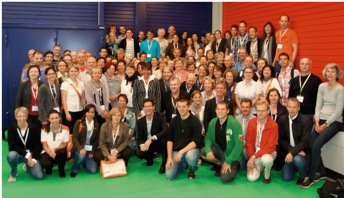
Die Schweizer Delegation in Amsterdam. | La délégation suisse à Amsterdam.

Les réseaux sociaux peuvent être utilisés professionnellement, comme le montre notamment le réseau international de physiothérapeutes dans le domaine de la paraplégie (Spinal Cord Injury) via facebook. Le potentiel pour la physiothérapie est évident, lorsque l'on sait que la technologie va continuer à évoluer de manière ultra-rapide ces prochaines années.