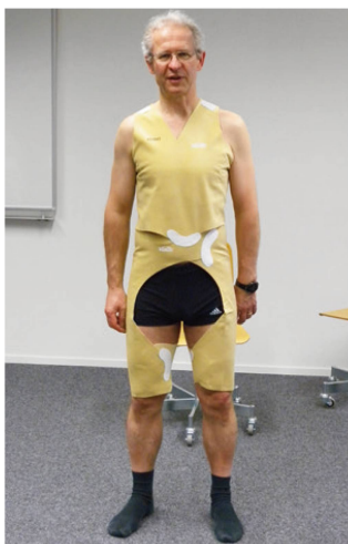
Abb. 1: Der TheraTogs-Undersuit (normalerweise ohne Unterwäsche direkt auf der Haut aufliegend). | III. 1: La combinaison TheraTogs (normalement sans sous-vêtement, directement sur la peau).

Les cannes augmentent cependant la surface d'appui et améliorent la stabilité lors de la marche grâce à l'utilisation du bras. Les stratégies de support fixe «normales» sont moins nécessaires et moins mobilisées. L'utilisation des bras pourrait solliciter davantage des réseaux corticaux qui ne sont normalement utilisés que pour les réactions de changement de support. Cela signifie que sur une surface sûre, des ressources cognitives plus importantes sont nécessaires pour pouvoir garder l'équilibre. Sur le long terme, cela peut réduire les réactions d'équilibration automatiques avec support fixe. L'une des conséquences possibles est que moins de ressources cognitives soient disponibles dans certaines conditions difficiles, comme marcher à l'extérieur ou dans les transports publics.