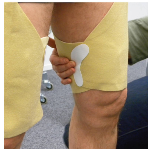
Abb 2+3.: Die Ober- und Unterteile werden individuell angepasst und mit Klettverschlussstreifen verschlossen. | III. 2+3: Les parties supérieures et inférieures sont adaptées individuellement et fermées par des velcros.