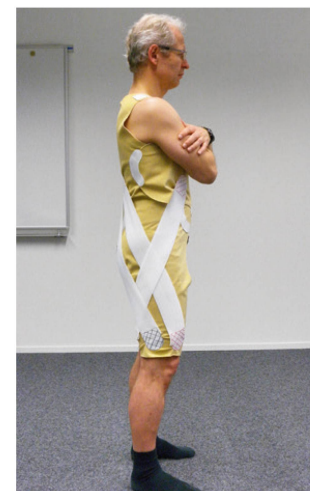
Abb. 4+5: Zusätzliches Straffen des Undersuits: Der Druck durch das Straffen soll ähnlich wie das therapeutische Handling die Muskelaktivität fördern. Auf dem Bild wird durch das Straffen die Aktivität der Hüftabduktoren faziilitiert. | Ill. 4+5: Resserment de la combinaison: la contraction doit exercer une pression de manière à stimuler l'activité musculaire, comme la manipulation thérapeutique. Sur l'image, l'activité des muscles abducteurs de la hanche est facilitée par la contraction.