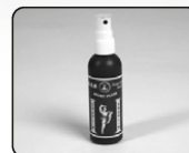
Shaolin Sport Flyuid