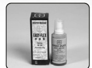
Easy Flex Spray Kräuterpray