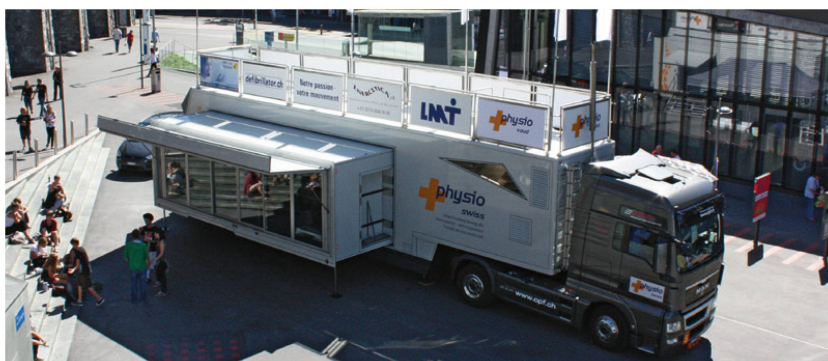
Der physiobus 2011. | Le physiobus 2011. | Il physiobus 2011.

La partenza è stata data a Sursee l'8 settembre in occasione della Giornata internazionale della fisioterapia. La SF 1