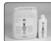
Pino Liquiderma® Super Soft Lotion