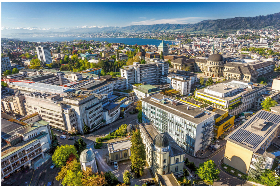
Universitätsspital Zürich: Mitarbeiterförderung und Organisationsentwicklung gehen Hand in Hand. | À l'Hôpital universitaire de Zurich, la promotion des collaborateurs et le développement de l'organisation vont de pair.

«En tant que patient, je considère qu'une physiothérapie bien faite implique que je sois entendu, que je me sente en sécurité, que je puisse participer au traitement et surtout que je constate des progrès.» Le point de vue des patients est très important en ce qui concerne la promotion de par-