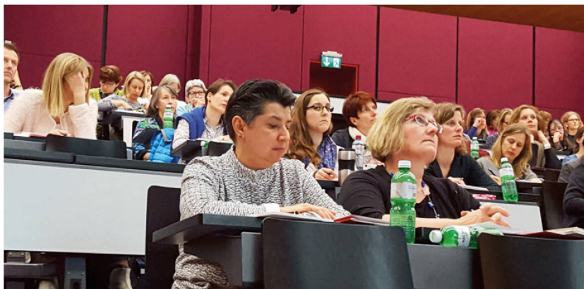
Die TeilnehmerInnen der «Physiotherapia Paediatrica»-Fachtagung 2016 in Bern. | Les participants de la conférence «Physiotherapia Paediatrica» 2016 à Berne. | I partecipanti alla conferenza «Physiotherapia Paediatrica» 2016 a Berna.