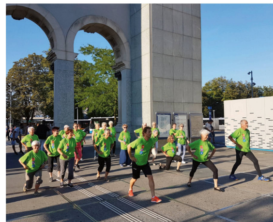
Der Flashmob in Luzern. | La flashmob à Lucerne. | La flashmob a Lucerna.

Sulla scia del motto generale «Anni con più vita», un piccolo gruppo di ballerini motivati dell'associazione regio-