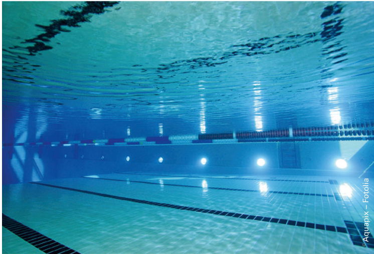
Ein Training im Wasser kann einen erhöhten Temperaturanstieg dämpfen. | Un entraînement dans l'eau permet d'atténuer l'augmentation de la température corporelle.

können unter anderem zu intensives Training, zu kurze Erholungsphasen oder eine falsche Ausführung der Übungen sein. Gesteigerte Symptome oder zu starke Ermüdung nach dem Training können die Sturzgefahr erhöhen oder Alltagstätigkeiten negativ beeinflussen. Verstärkt das Training zusätzlich die Spastik, kann die Selektivität der Muskulatur und damit die Bewegungskontrolle darunter leiden.