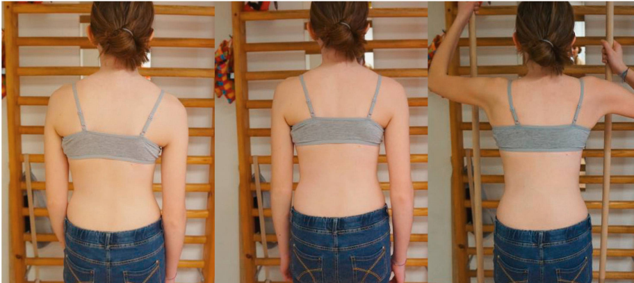
Bild links: unkorrigierte Haltung. Bild Mitte: aktive 3D-Korrektur. Bild rechts: Ausdehnung der eingefallenen konkaven Körperteile mit Hilfe der Atmung und anschließender Muskelspannung, um Korrekturen zu halten. | Image de gauche: posture non corrigée. Image du milieu: correction 3D. Image de droite: extension des parties du corps concaves et creuses au moyen de la respiration et d'une tension des muscles de manière à maintenir les corrections.

Index 6 . Er zeigt mit Messungen auf einem Foto auf, wenn sich die Haltung verbessert. Sehen die Jugendlichen die Fortschritte, dann steigt die Motivation. Auch Gruppenstunden und Skoliosewochen sind förderlich.