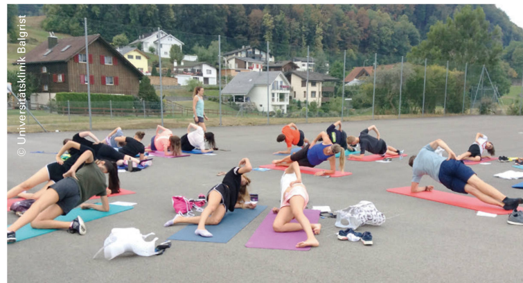
Neben skoliosespezifischen Therapieeinheiten wird auch viel an der Rumpfkraft gearbeitet. | En plus des unités thérapeutiques propres à la scoliose, un travail sur la force du tronc est également réalisé.