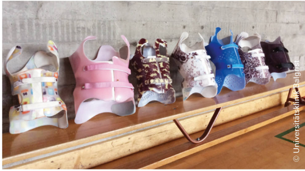
Gemeinsames Training und der Austausch wirken motivierend. | S'entraîner en commun et les échanges entre participants s'avèrent motivants.