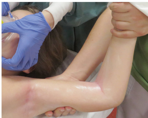
Mobilisation in Narkose. | Mobilisation sous anesthésie.

Ces douleurs peuvent être continues ou récurrentes et varier considérablement en intensité, en localisation ou en qualité. La douleur devient alors une maladie à proprement parler et perd sa fonction d'alerte biologique. La douleur chronique (CP: chronic pain ) peut être causée tant par une maladie somatique manifeste (p. ex. arthrite idiopathique juvénile, maladies malignes) que sans corrélation somatique. La douleur chronique a toujours des composantes biologiques, psychologiques et sociales qui doivent être identifiées au cours du traitement.