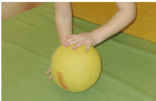
Spiele in der Funktion. | Des jeux pour exercer la fonction.

Wenn die Schmerzproblematik einen normalen, altersgerechten Alltag über lange Zeit verhindert (Schulabsentismus, sozialer Rückzug), und der Patient akut von Sekundärschäden (wie Kontrakturen, Luxationen, dystrophe Extremitäten) bedroht ist, oder diese schon aufweist, sowie der Leidensdruck