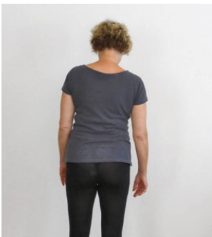
Abbildung 2: Shift nach rechts. | Illustration 2: Déplacement vers la droite.

Bei Diana fällt ein Schonhinken und ein deutlicher Shift nach rechts auf ( Abbildung 2 ). Die Bewegungsausmasse in Flexion und Extension sowie Seitgleiten nach links sind stark eingeschränkt und diese Bewegungen «peripheralisieren» die Symptome (verstärken die distalsten Symptome). Der SLR misst 30°. Die passive manuelle Shiftkorrektur ( Abbildung 3 ) verstärkt die Schmerzen in der Wade. Repetierte Bewegungen in entlasteter Ausgangsstellung (Extension und Flexion im Liegen) peripheralisieren die Symptome.