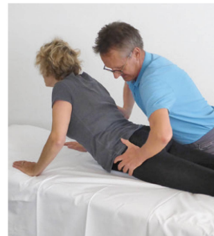
Abbildung 7: Repetitierte Extension mit hips-off-center. | Illustration 7: Extensions répétées en position hips off center .

Diana est invitée à effectuer 10 ERPA toutes les deux heures – si des symptômes unilatéraux apparaissent, en posi-