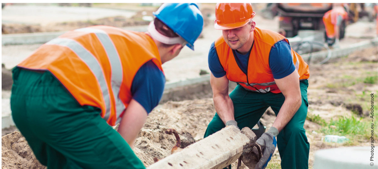
Die Belastung der Wirbelsäule ist bei beiden Hebetechniken gleich gross. | La charge imposée à la colonne vertébrale est la même dans les deux techniques pour lever une charge.

F. K.: Exactement. Et éviter les charges a un effet négatif sur la forme physique, ce qui augmente encore la probabilité de