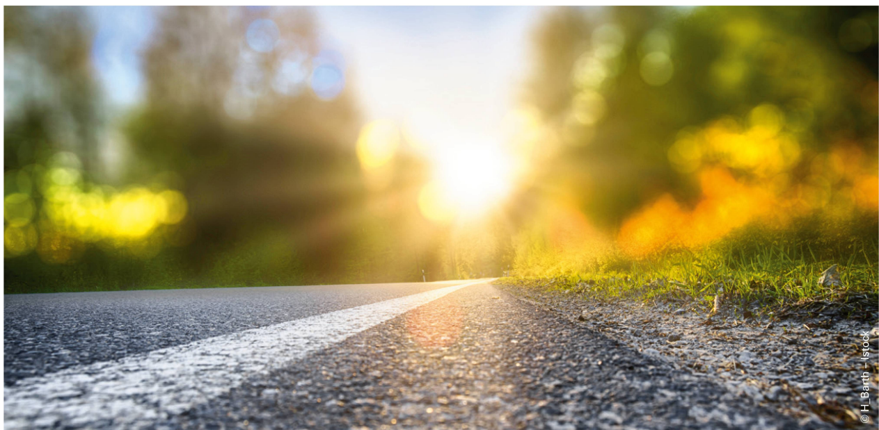
Leitlinien werden im Durchschnitt nach sechs Jahren erneuert. | Les recommandations de bonne pratique sont renouvelées en moyenne après six ans.

La méthode GRADE est une approche largement utilisée pour évaluer la qualité ou la certitude des données probantes. Elle