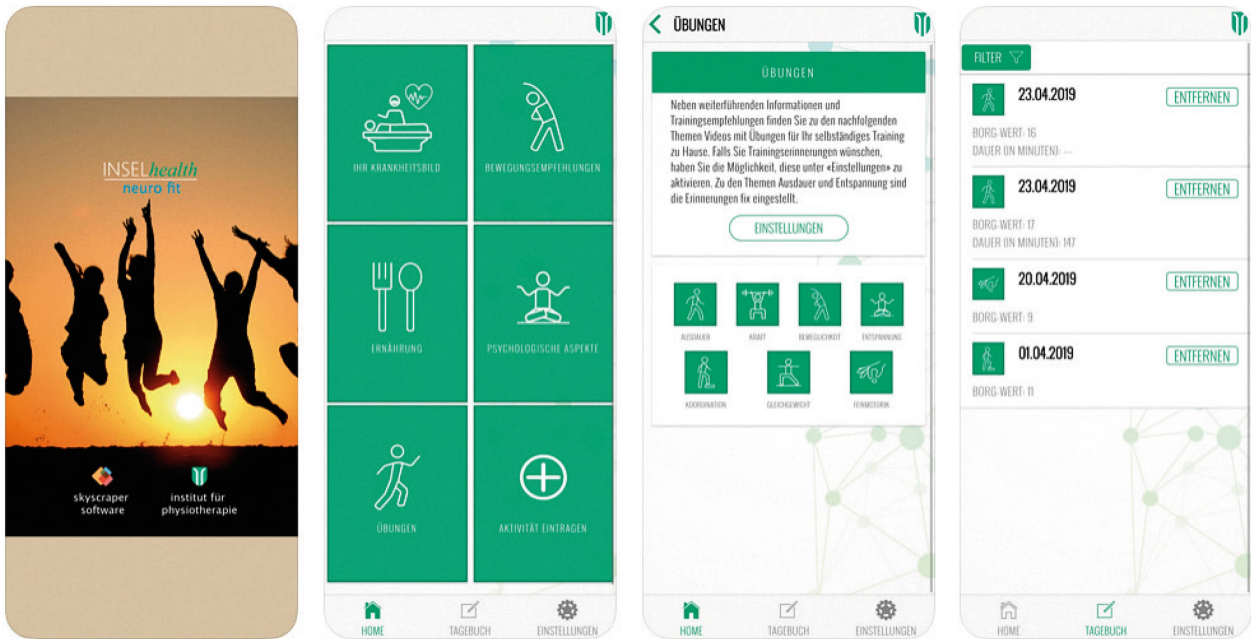
Die App «Inselhealth Neuro fit» unterstützt die PatientInnen im Alltag. | L'application «Inselhealth Neuro fit» soutient les patient·e·s au quotidien.

sen. Die Betroffenen nehmen die minimalen Defizite bei den konditionellen Grundfaktoren sowie in der Konzentration häufig erst im angestammten Umfeld und beim Bestreiten des Alltages wahr. Die Patienten sind mit den nun spürbaren Defiziten oft überfordert. Häufig bestehen auch Ängste vor Komplikationen oder vor einem weiteren Ereignis. Die Patienten sind zudem unsicher, wie stark sie sich im Alltag und bei der Arbeit physisch und psychisch belasten dürfen. Und sie wissen nicht, wie sie ein Training dosieren sollen. Das Neurofit-Programm holt die Betroffenen an diesem Punkt ab: Vor allem zu Beginn des Neurofit-Programms beanspruchen die Patienten die Beratung der Fachpersonen stark. Auch der Austausch in der Gruppe schätzen die Teilnehmenden sehr. Die durch die Unterstützung und Begleitung entwickelte Achtsamkeit und Gelassenheit verbessern die Lebensqualität und fördern die Selbstwirksamkeit.