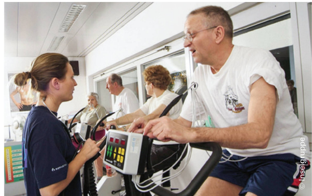
Veloergometer: Individuelle Betreuung auch in der Gruppe. | Vélo ergomètre: un accompagnement individuel aussi en groupe.