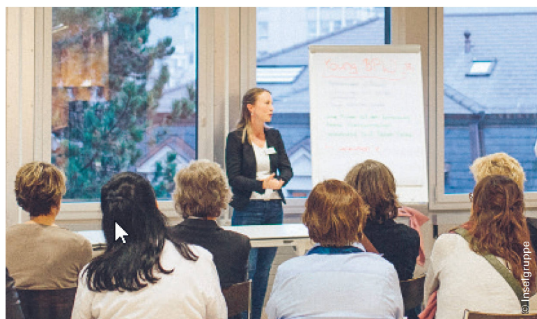
Vorträge zu Ernährung, Medikamenten und Prävention fördern die Selbstwirksamkeit. | Des conférences sur la nutrition, sur les médicaments et sur la prévention favorisent l'efficacité personnelle.

C'est là qu'intervient le programme Neurofit auprès des personnes concernées: surtout au début du programme, les patients ont grand besoin de conseils de spécialistes. L'échange au sein du groupe est également très apprécié par les participants. L'attention et le calme développés par le soutien et l'accompagnement améliorent la qualité de vie et favorisent l'efficacité personnelle.