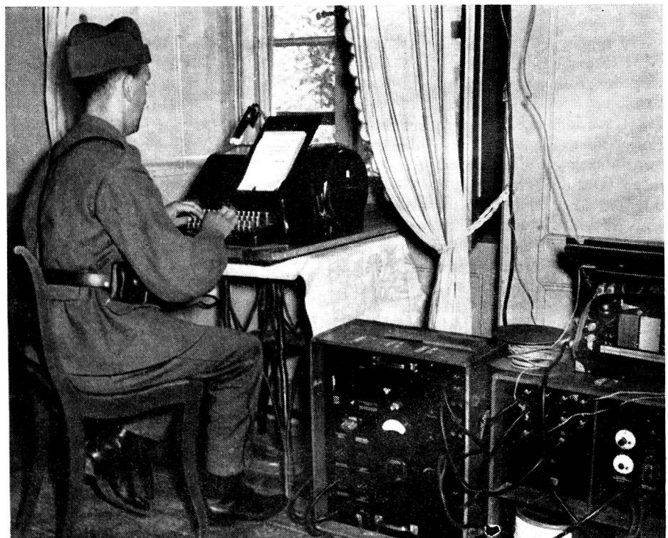
Der Fernschreiber, das moderne Drahtverbindungsmittel der höheren Stäbe.

Der Meldeläufer (Fahrer, Reiter) steht dem Truppenführer immer und auch als letzte Möglichkeit der Nachrichtenübermittlung zur Verfügung, wenn alle an-