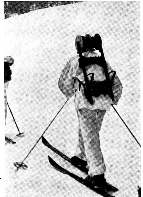
Rechts: Telephon-Soldat beim Bau einer doppeldräftigen Telephon-Verbin- dung. (Zens.-Nr. VI Br. 9244.)

grossen Geschwindigkeit. — Um überlegen an entscheidender Stelle zu erscheinen, was — nach Clausewitz — die Vorbedingung für die Ueberraschung ist, sowie für das rasche Erkennen der Absicht des gegenüberliegenden Gegners, als auch das Auswerten der Lage in einer brauchbar kurzen Zeitspanne, erfordert es die Beherrschung dieses Nachrichtenapparates.