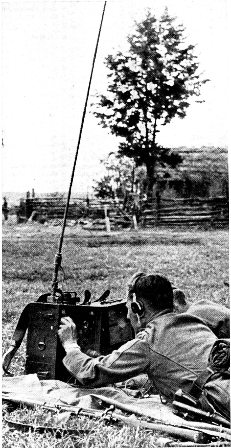
Deutsche Inf.-Funker in Tätigkeit auf dem russischen Kriegsschauplatz. Die offene Aufstellung im freien Gelände lässt darauf schliessen, dass es sich um eine rückwärtige Station handelt.

«Der militärische Wert der Drahtverbindungen bleibt der Funkverbindung immer überlegen, auch wenn im Frieden die Funkverbindung die Drahtverbindung mehr und mehr ausschalten sollte. Selbst wenn es gelingen würde, die Abhörsicherheit des Funkspruchs zu gewährleisten, so bleibt die Gefahr beabsichtigter Störung und teilweiser Unterbindung stets bestehen. Ich halte es für notwendig, dass die dauernde Drahtverbindung im Bewegungskrieg zu einem System wird, auf das die Führung rechnen kann.»