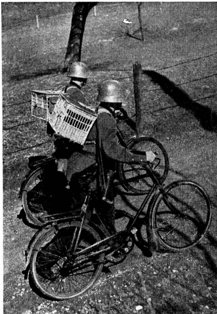
Links: Brieffaubentransport im Infanterie- Tragkorb. (Zens.-Nr. A N 100.)