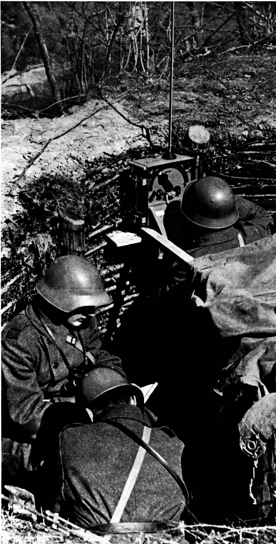
Vorgeschobene Infanterie-Funkstation mit Patrouillengerät. Zur sofortigen Tarnung beim Auftauchen von Fliegern liegen Zelteinheiten bereit. (Zens.-Nr. N F 6974.)

Telephon-Verbindung durch Kunstschtaltung den Drahttelegraph anzuschliessen, ohne die eine oder andere Verbindung zu beeinträchtigen.