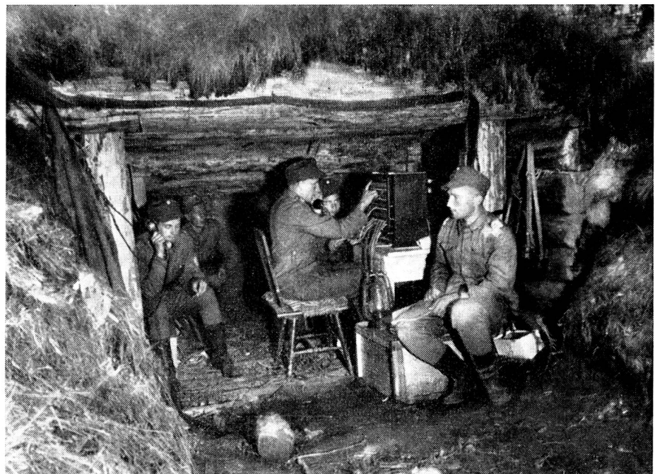
Finnische Regiments-Telephonzentrale in einem splittersicheren Gefechtsunterstand an der ostkareelischen Front.

Der Drahttelegraph gibt die Nachricht schreibend oder hörbar wieder. Er erfordert aber ebenfalls eine Drahtverbindung, die wiederum Zeitaufwand verursacht. Es ist jedoch auch möglich, auf eine schon bestehende