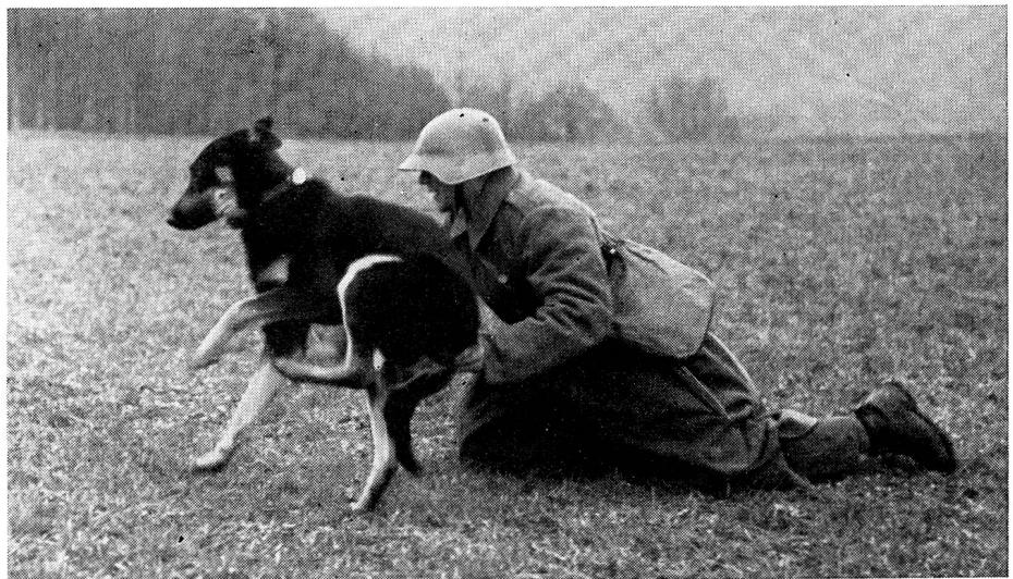
Abgang eines Meldehundes. Auf den Zuruf «Dung» (Meldung) seines Führers schnellte das eben noch zusammengeduckte Tier fort. (Zens.-Nr. A Fi 0046.)

mass haben im Laufe der Zeiten ständig mit der Kriegsorganisation Schritt gehalten. So sichert dieser Nachrichtenapparat heute der modernen Kriegführung die Uebersicht und entscheidende Truppenführung, sei es im unübersehbar grossen Raume oder in der unendlich