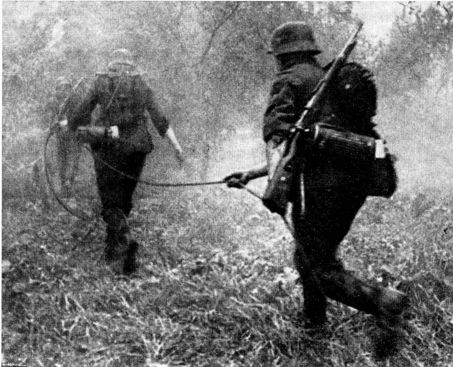
Deutscher Nachrichtentrupp beim Verlegen eines Mehrfachkabels kurz nachdem das Gros der Infanterie den Kampfabschnitt besetzt hat.

dern Mittel versagen. Es gibt unzählige Beispiele, wo die todverachtende Arbeit eines Meldeläufers die Rettung aus einer schwierigen Lage brachte.