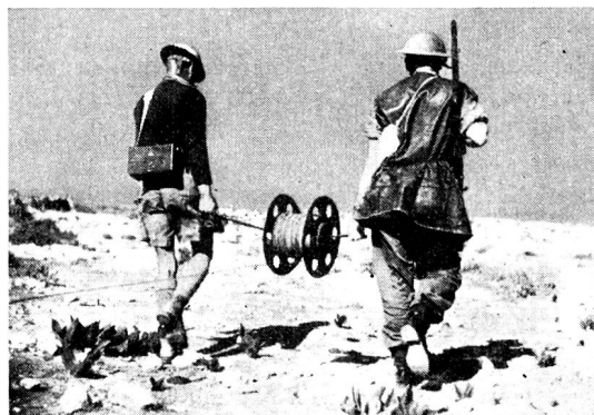
Britische Telephonsoldaten beim Legen einer Leitung in der Wüste