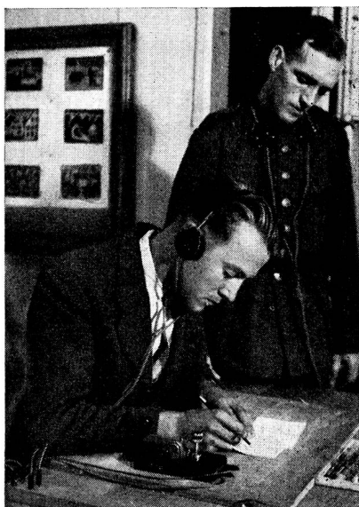
Jungfunker beim Gehörablesen im Morsekurs