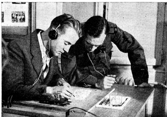
Jungfunker beim Gehörablesen im Morsekurs.

Durch den Umstand, dass lt. Verordnung über den Vorunterricht sämtliche Kursleiter in einem zentralen Kurs für ihre Aufgabe ausgebildet werden konnten, sind die in den vergangenen Kursen erreichten Resultate schon sehr erfreulich. Es zeigte sich vor allem, dass durch diesen Kurs eine persönliche Fühlungnahme aller mitarbeitenden Leiter und Lehrer das nötige Verständnis für ihre Aufgabe herbeiführte. So wurde an vielen Orten durch aktive Funker, die selbst noch sehr viel Dienst zu leisten hatten, grosse Arbeit geleistet. Resultat: Für die im Laufe des Jahres stattfindenden Rekrutierungen für die Funker aller Waffengattungen stehen, in Anzahl und Können nunmehr annähernd vollständig den Forderungen der Armee entsprechend, gut vorgebildete Jünglinge bereit.