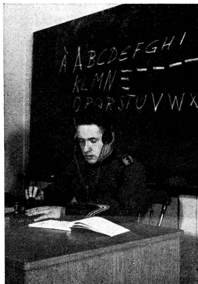
Der Kursleiter beim Uebermitteln des Übungstextes

Die Kurse wurden in drei Kursstufen durchgeführt, für Anfänger und Fortgeschrittene, deren Uebermittlungstempo im Durchschnitt zwischen 25 und 60 Z/Min. schwankten. Dieses Resultat zeigt deutlich, dass die gewissenhafte und systematische Ausbildungsarbeit eine nicht zu unterschätzende Grundlage für die Ausbildung in den Rekrutenschulen darstellt.