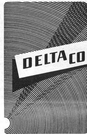
SCHWEIZ. PRÄZISIONSSCHRAUBENFABRIK UND FASSONDREHEREI SOLOTHURN

Die Broschüre „Appara- tenkenntnis für die Tf- Mannschaften aller Truppengattungen“ kann zum Preise von Fr. 1.50 (plus 10 Rp. Porto) bei der Red. des „PIONIER“ bezogen werden (Post- check VIII 15666).