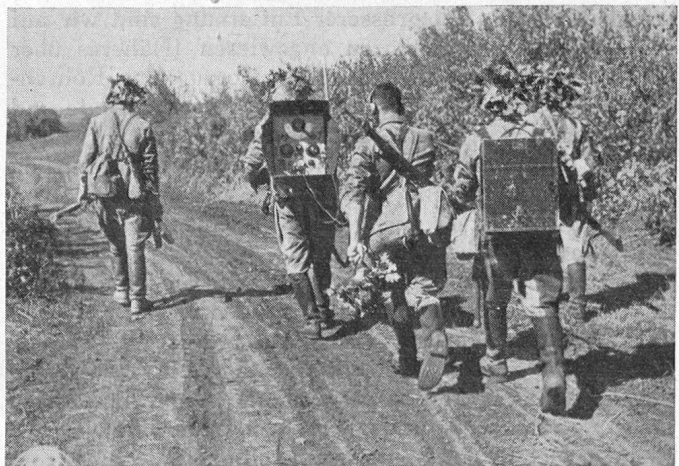
Rumänische Funker auf dem Marsch an der Ostfront.