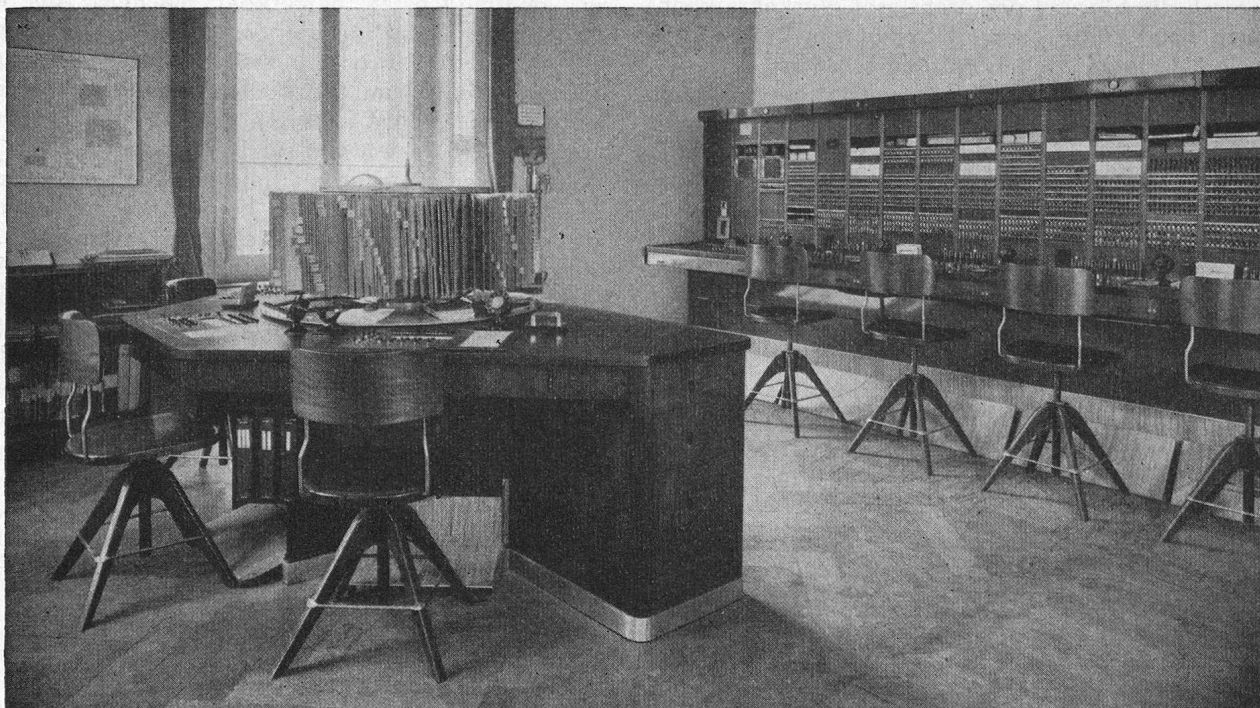
Fig. 1. Der Auskunftstisch des Fernamtes Chur.