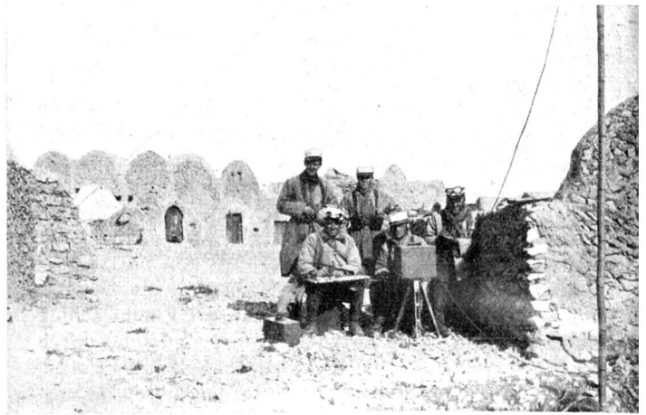
Funk-Posten in Médénine (Süd-Tunesien).

Für den Signaldienst wurden meistens die Panneaux à bras verwendet. Eine Seite war weiss, die andere rot; je nach dem Hintergrund wurde die eine oder andere Farbe angeordnet. Vielfach arbeiteten wir mit dem Heliographen. Das Sonnenlicht war sehr stark; bedenken wir, dass während 10 Monaten ein tiefblauer Himmel über Tunesien, dem Lande der ewigen Sonne, schwebt. Der Apparat war einfach. In einem ca. 30 cm langen Rohr war eine Linse mit Fadenzug, auf dem Rohr waren der Hauptspiegel und der nach allen Seiten drehbare Hilfsspiegel angebracht; vorn war eine Metallscheibe mit einer Rückhaltefeder und einer Kette. Durch die auf- und Abwärtsbewegung dieser Metallscheibe wurde das Licht nach Strich und Punkten unterbrochen. Es war interessant, mit diesem Gerät zu arbeiten, denn da sich die Sonne dauernd verändert, resp. ihren Standort än-