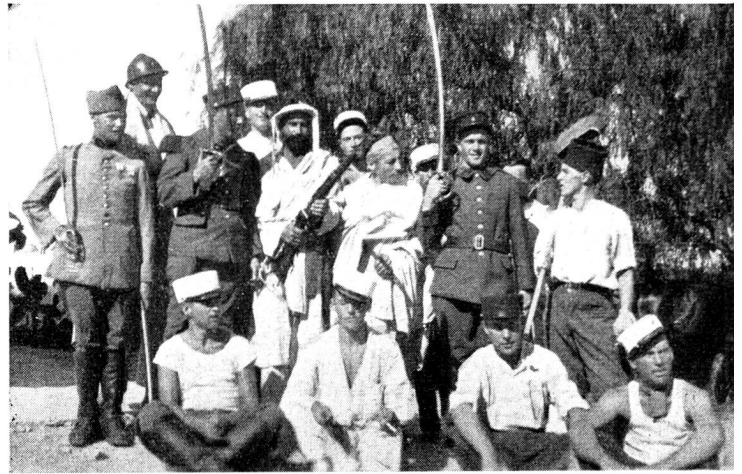
Auf diesem Bild ist der Grossteil der Groupe des Transmissions in den verschiedensten Uniformarten. — Es war am 11. 11. 1935, an der Feier zur Erinnerung des Waffenstillstandes von 1918.

Jedesmal, wenn ein «Renfort von Blauen» in Sousse eintraf, erkundigte sich unser Chef sogleich nach Beruf und Nationalität der angekommenen Leute. War dann die Instruktionszeit in Sidi-el-Hani vorbei, holte er sich seine vor sechs Monaten schon vorgemerkten T.S.F.-Aspiranten heraus. Zwar trugen es ihm seine Kollegen schwer nach, er suche immer die besten Leute für sich heraus. Damals schon war ich für den Nachrichtenzug vorgesehen, d. h. vor der Ausbildungszeit zum Fremdenlegionär und Kavalleristen, und so kam ich in die Groupe des Transmissions. Damit will ich nun aber beileibe nicht behaupten, dass ich zu den besten Leuten gezählt habe. Die Instruktionszeit in Sidi-el-Hani war eine höllische Angelegenheit, sage ich Ihnen, was Wunder, wenn gerade in dieser Zeit die meisten probieren die Flucht zu ergreifen, zu desertieren. So weit liess ich mich nicht in die Brüche rinein und gab mich lediglich mit den frömmsten Wünschen zufrieden, der Teufel möge die ganze Fremdenlegion mit ihrem Anhang holen.