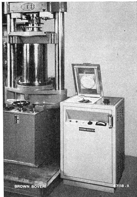
Mit diesem 1-kW-Hochfrequenz-Röhrengenerator wird das in der Kunststoff-Fabrikation verwendete Presspulver in kürzester Zeit durchwärmt und plastisch. Der anschliessende Pressprozess wird abgekürzt und die Produktion gesteigert.

mehreren Jahren mit Erfolg arbeitet, orientieren einige instruktive Ausstellungsobjekte. Ein vielseitiges Spezialgebiet stellt z. B. die Herstellung von luft- und wassergekühlten Sende- und Spezialröhren dar; sie werden in werkeigene Rundfunksender für Mittel-, Kurz- oder Ultrakurzwellen, in Sender der kommerziellen Telegraphie, in HF-Röhrengeneratoren für industrielle Zwecke eingebaut und eignen sich auch