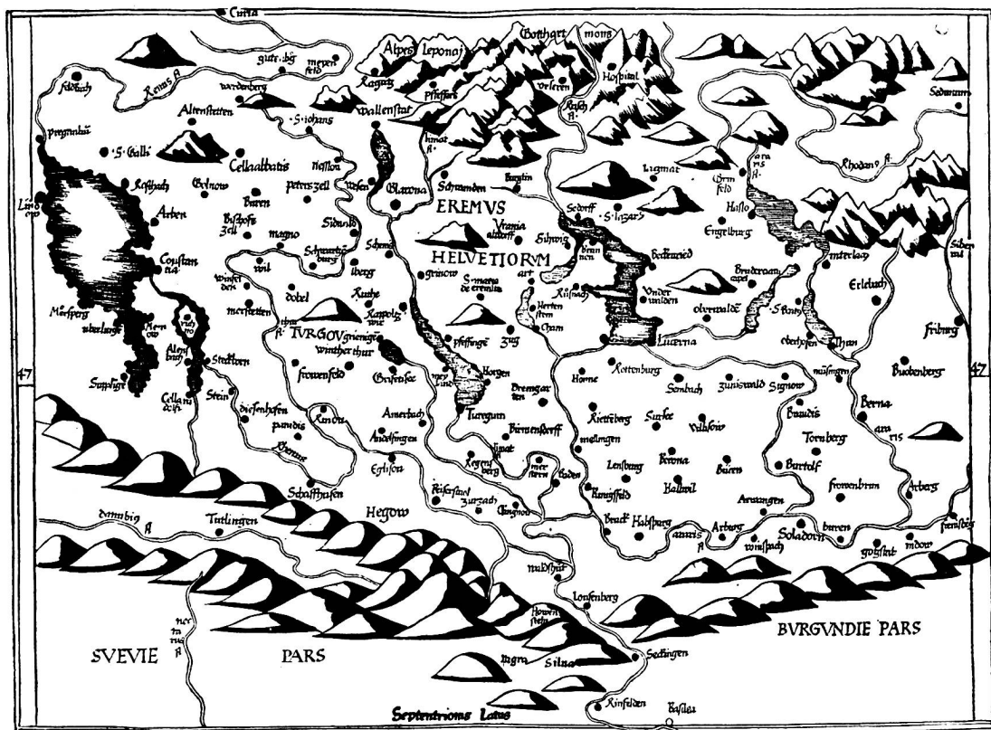
Gesamtwiedergabe der im Format 30 : 40 cm erschienenen zweiten Schweizerkarte des Martin Waldseemüller. Die Karte wurde im Jahre 1520 gezeichnet und zwei Jahre später in Straßburg gedruckt. / Reproduction complète de la 2 e carte de Martin Waldseemüller, du format 30 : 40. Cette carte fut dessinée en 1520 et imprimée deux ans plus tard à Strasbourg.

Auch der bekannteste Chronist unseres Landes, Johann Stumpf, befaßte sich nicht nur mit der Geschichtsschreibung, sondern auch mit der Kartographie, die ja in früheren Jahrhunderten immer eng mit historischen Arbeiten verbunden war. Stumpf hatte den Entschluß gefaßt, jedem Band seiner umfangreichen Geschichte der Eidgenossenschaft eine selbstgezeichnete Karte des beschriebenen Gebietes beizufügen. Stumpf zeichnete selbst nach verschiedenen Quellen und eigenen Studien prachtvolle Karten, welche der bekannte Schweizer Buchdrucker der Frühzeit, Christoffel Froschauer, in seiner Zürcher Offizin druckte. Froschauer hatte auch den Druck der Stumpfschen Chroniken übernommen und uns damit Werke hinterlassen, die ein Zeugnis der hochstehenden schweizerischen Buchdruckerkunst des 16. Jahrhunderts ablegen. Diese neuen Karten Stumpfs wurden bald so berühmt und in aller Welt beliebt, daß der Drucker Anno 1552 zwölf von ihnen zu einem Atlas vereinigt erscheinen ließ. Auf diese Weise entstand, angeregt durch den Wunsch der Käufer, der erste vollständige Schweizer Atlas, der damals zugleich der einzige Atlas eines Staates war. Dieses schöne Druckwerk war so gefragt, daß fast jedes Jahr Neuausgaben erschienen, bis allmählich Stumpfs Landkarten durch bessere Karten verdrängt wurden.