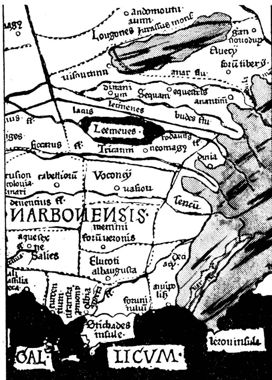
Ausschnitt aus der Gallia-Karte des Ptolomäus (Ulm 1482). Fragment de la carte Gallia de Ptolémée (Ulm 1482).

Im Mittelalter versuchten die Kartenmacher, die ihnen bekannte Welt in einen Kreis einzuzeichnen, und so ent-