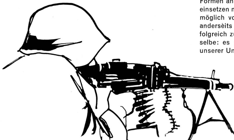
Das Maschinengewehr, ein Symbol aller Abwehr. Es muss heute durch andere Waffen wirkungsvoll ergänzt werden.

Das äussere Bild der schweizerischen Armee hat sich dauernd gewandelt. Unwandelbar blieb dagegen der Wille, sich jedem Angriff wirkungsvoll zu widersetzen. Der Grund-gedanke aller unserer Wehranstrengungen ist und bleibt, dem Gegner einen Angriff auf unser Land im Verhältnis zu dem, was er gewinnen würde, so unrentabel zu machen, dass er ihn gar nicht erst versucht. Dies bedingt nicht nur irgendeine, sondern eine starke Armee. Im Zeitalter der Atomwaffen wird unsere Verteidigung noch einmal andere Formen annehmen. Wir werden vermehrt technische Mittel einsetzen müssen, um einerseits unsere Soldaten so gut als möglich vor der Feindeinwirkung zu schützen und ihnen anderseits zu ermöglichen, ihre Verteidigungsaufgaben er-folgreich zu lösen. Doch das Ziel bleibt nach wie vor das-selbe: es geht um Verteidigung — um die Verteidigung unserer Unabhängigkeit und unseres Bodens.