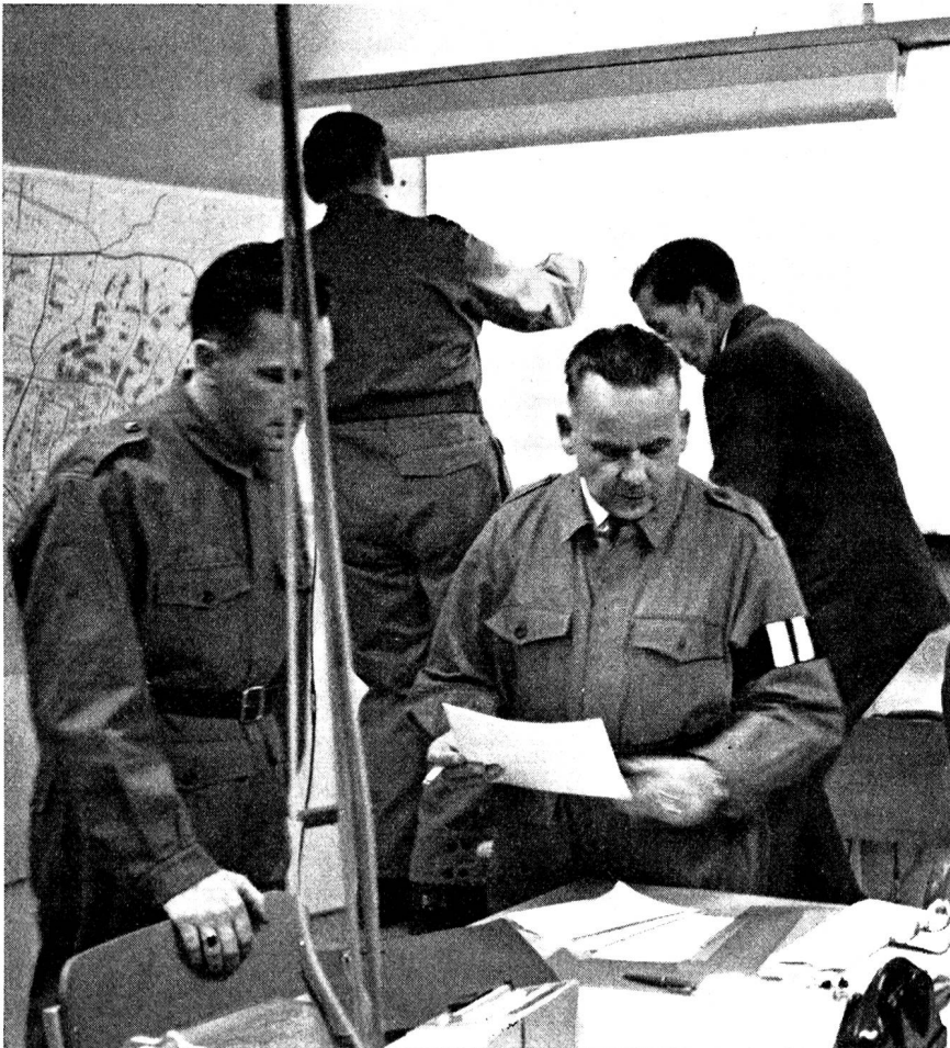
Der Ortschef in seinem Kommandoposten. Auf ihm ruht die grosse Verantwortung über Leben und Gut der Bevölkerung. Nur der beste Mann einer Gemeinde, der Vertrauen und Autorität nach oben und unten geniesst, ist dieser Aufgabe gewachsen, auf die er sich verantwortungsbewusst bereits im Frieden vorbereiten muss; auch er hat freiwillig und ausserdienstlich einen grossen Einsatz zu leisten.

an bekannten Geräten und in erlernten Funktionen eine ganze Reihe interessanter Aufgaben warten. Es darf erwartet werden, dass sich die aus der Wehrpflicht entlassenen Offiziere, Unteroffiziere und Soldaten dieser humanitären und sittlichen Verpflichtungen unserer Zeit nicht entziehen und, soweit sie nicht den Dienst im Selbstschutz im eigenen Heim oder am Arbeitsplatz vorziehen, sich verständnisvoll dem Alarm-, Beobachtungs- und Verbindungsdienst des örtlichen Zivilschutzes ihrer Gemeinde zur Verfügung stellen. Die Ortschefs werden dankbar sein, auf allen Stufen über in der Armee bewährter Mitarbeiter zu verfügen.