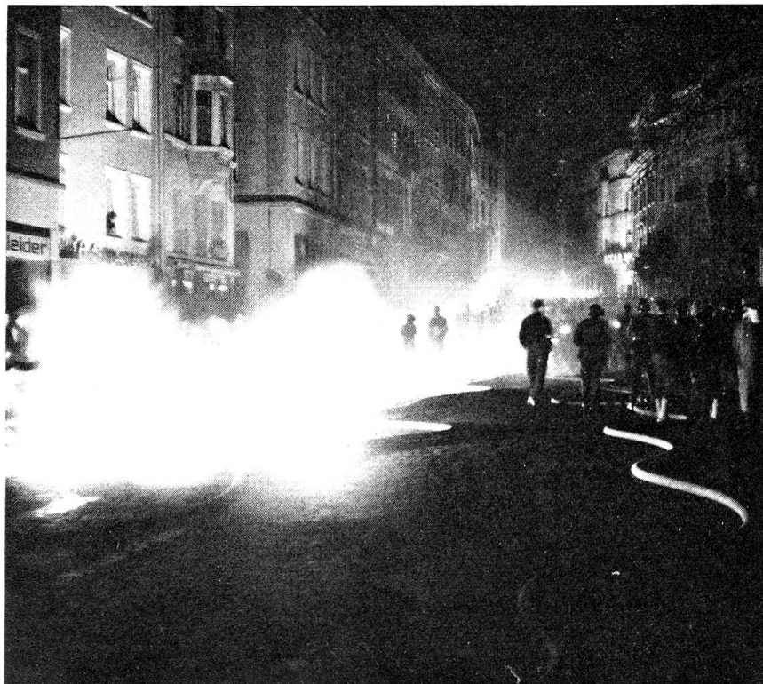
Jedes Jahr finden in unseren Städten verschiedene kombinierte Zivilschutzübungen statt, die der örtlichen Zivilschutzorganisation mit ihren Dienstzweigen Gelegenheit zur Zusammenarbeit mit den Luftschutztruppen bieten. Oben: Ausschnitt aus einer Übung in St. Gallen.

In diesem Zusammenhang stellt sich auch das Problem Wehrmann und Zivilschutz, das im Rahmen der Debatten um das kommende Zivilschutzgesetz mehrmals auftauchte und leider da und dort zu irrigen Auffassungen führte. Die hier geschilderte Bedeutung der Verbindung und Übermittlung im Zivilschutz lässt erkennen, dass den Angehörigen der Übermittlungstruppen nach ihrer Entlassung aus der Wehrpflicht im Rahmen der örtlichen Zivilschutzorganisationen