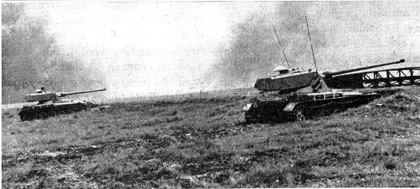
Von oben nach unten: Ein Funktrupp überwacht die Entwicklung des Angriffes, das Vorgehen der eigenen Truppen und die Lage des Unterstützungsfeuers der schweren Waffen, um den Kommandanten der Aktion fortlaufend orientieren zu können. — An der Demonstration auf Tannenboden waren auch Infanteriefunker beteiligt. — Bild von der Demonstration auf dem Schiessplatz Paschga. Im Schutze der Panzer geht die Infanterie vor. — In der ersten Phase des Angriffes gegen Luftlandtruppen sind AMX-Panzer aufgeföhren. Gleichzeitig verschiessen die Minenwerfer Nebelmunition, um dem gelandeten Gegner die Sicht zu nehmen.