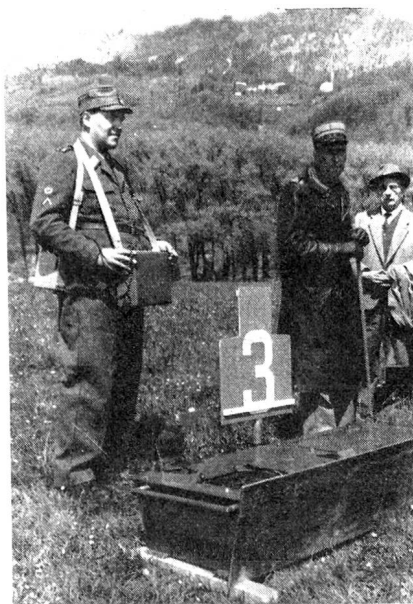
Eine der Scheiben und das Funksteuergerät der neuen Scheibenanlage «Zschokke», wie sie im Bericht geschildert wird (Photopress).

Eindruck. Sie vermochten besser als Worte den hohen Wert der Schiessschule Walenstadt zu dokumentieren und auch für den guten Geist zu sprechen, der das Teamwork des Lehrkörpers beherrscht. Sehr eindrücklich kam vor allem auch die Zusammenarbeit der Infanterie mit den Panzern, der schweren Waffen des Bataillons mit der vorgehenden Infanterie und der Einsatz der Grenadiere zum Ausdruck, das Bild der Vorführungen in den Flumsberger abruhend.