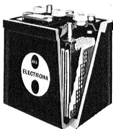
Auto-Batterie 6 Volt, eine Zelle im Schnitt

Wenn schon im zivilen Einsatz Autobatterien stark beansprucht werden, um Sicherheit und Fahrkomfort des Automobilisten zu erhöhen, so sind bei den extremen Verhältnissen im militärischen Einsatz ganz spezielle Anforderungen an die Batterie eines Motorfahrzeuges gestellt. Aber immer soll sie eine maximale Leistung, lange Lebensdauer sowie eine rasante Startfähigkeit aufweisen. Aufbau und Konstruktion der Elemente beeinflussen die Lebensdauer auch bei ungünstigsten Verhältnissen und die Startleistung bei hohen und besonders