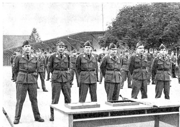
Das ist die Siegermannschaft der Fk. Kp. 29, die für ein Jahr den Wanderpreis als Mannschaftsmeister der Uebermittlungstruppen in Obhut nehmen durfte.

Der Wettkampf selber zerfiel in drei Phasen. Einmal musste während der Nacht vom Samstag auf den Sonntag eine KFF-