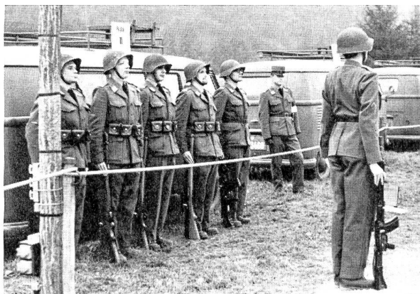
In strammer Achtungstellung: die Mannschaft der Fk. Kp. 22.