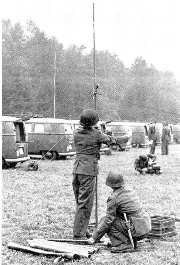
Schnappschuss von der Arbeit der Wettkampfgruppen am Sonntagmorgen: Stationsbau.

mit viel Liebe und besonderem Geschick für Übersichtlichkeit aufgebaut, vermochte leider das Interesse der Besucher nicht in dem erhofften Masse zu wecken. Das dürfte in erster Linie darauf zurückzuführen sein, dass unter dem Publikum zum allergrössten Teil Angehörige der Uebermittlungstruppen zu finden waren. Man hat es zweifellos unterlassen, insbesondere die Bevölkerung Bülachs durch geeignete Propaganda auf den Anlass hinzuweisen und zum Besuch der Kaserne einzuladen. Solche Veranstaltungen, an denen man die Beziehungen zur Öffentlichkeit pflegen will, bedürfen der Propaganda. In dieser Beziehung ist leider eine gute Sache schlecht verkauft worden.