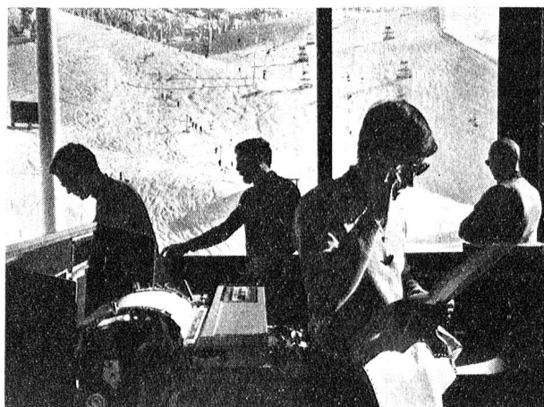
Die Aussenstation Chamrousse des Rechenzentrums der 10. Olympischen Winterspiele in Aktion. Im Hintergrund der Zielhang mehrerer alpiner Skiwettkämpfe.