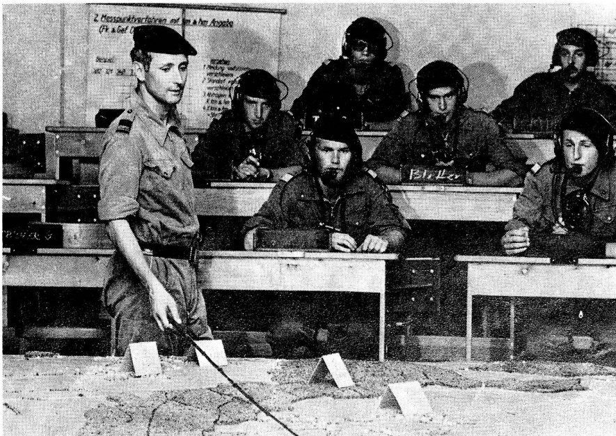
Ausbildung des Milizkadets: Befehlstechnik am Geländemodell

Der Instruktor ist indessen nicht nur ein Fachmann, der militärisches Wissen und Können zu vermitteln hat. Seine Aufgabe besteht vor allem auch im Wecken jener Bereitschaft des Einzelnen und der Ein-