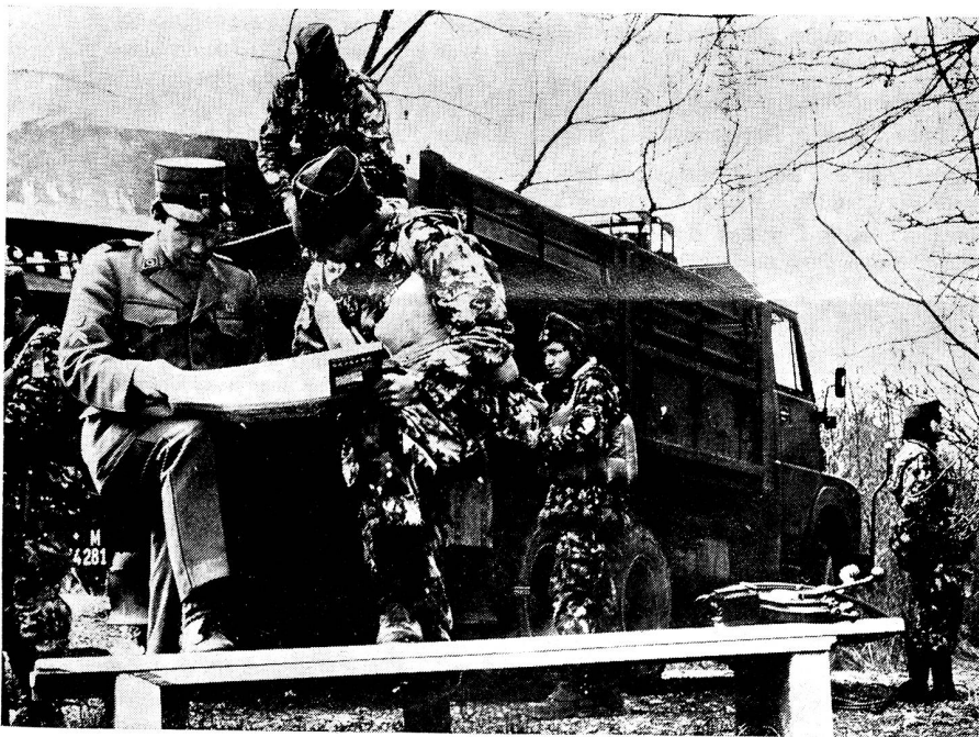
Letzte Vorbereitungen vor einer Uebersetzübung der Pontoniere

stellung des in Freiheit und Wohlstand heranreifenden Bürgers und der im Militär nicht zu umgehenden Pflichterfüllung und Auftragstreue ausgesetzt. Die Einsicht in den spezifischen Charakter einer militärischen Ordnung zu vermitteln, ist eine der anspruchsvollsten Aufgaben des Instructors. Ihn darin zu unterstützen, sollte ein Anliegen aller unseren Staat tragenden Kräfte sein. Denn die Tätigkeit des Instructors ist für unsere Armee von unschätzbarem Wert. Wenn wir also von einer Sicherheitspolitik der Schweiz sprechen, in der die Armee eine bedeutende Stellung einnimmt, so sollte nie vergessen werden, dass für die Ausbildung dieser Armee letzten Endes 1400 Leute zuständig sind, die des Vertrauens und der Unterstützung der Öffentlichkeit bedürfen.