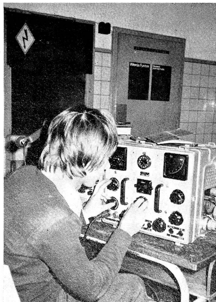
Das Frequenzwechseln an der SE-222 erfordert technisches Geschick

Verbindung um jeden Preis heisst das Motto bei den Funkern. Das berücksichtigten auch wir, als infolge Netzüberlastung die Sicherung ausfiel. Aggregat hatten wir keines, also suchten wir zuerst andere Stromquellen. Im Nebenraum fanden wir eine Anschlussmöglichkeit und konnten in Verdunkelung weiterfunken. Es herrschte eine romantische Stimmung! Mit nur einem Ofen wurde es immer kälter, so dass