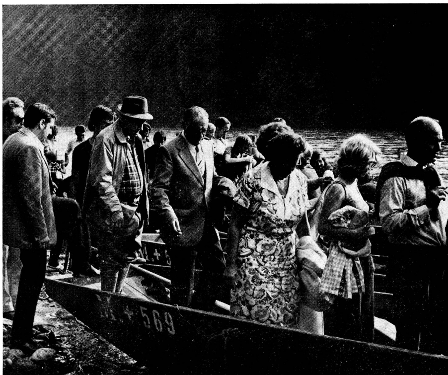
In Münsingen standen vier Pontons bereit und sechzig EVUler bestiegen die Schiffe