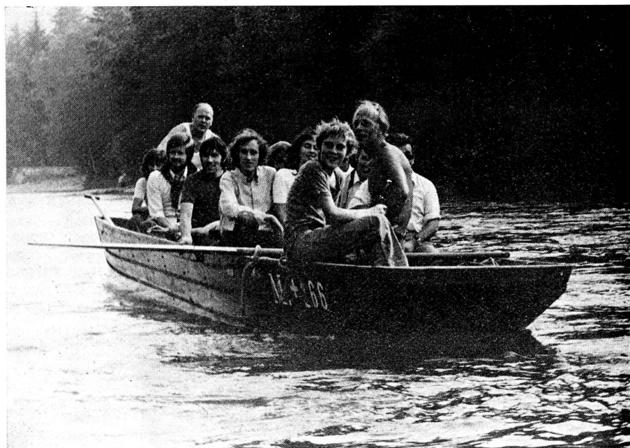
In der Folge konnte sie eine grossartige Fahrt durch die Aarelandschaft erleben

mit einem Rekordaufmarsch der Mitglieder, nahm sich wenig Zeit für die Details und überliess den Rest einmal dem Zufall. Um es vorweg zu nehmen: Der Anlass schlug ein! Strahlendes Wetter (es war das letzte schöne Wochenende dieses Herbstes) schaffte die Grundlage für einen tollen Tag, den man bestimmt so leicht nicht vergessen wird. Schon vor dem Mit-