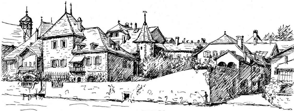
La Tour de Miséricorde, Coppet.

C'est avec plaisir que nous apprenons que votre assemblée aura lieu à Coppet, au Château, le 13 avril 1975 à 10 h. C'est un honneur pour notre petite ville de vous accueillir pour une journée, au cœur d'une région appelée la «terre Sainte». Nous espérons que ce pèlerinage vous sera bénéfique.